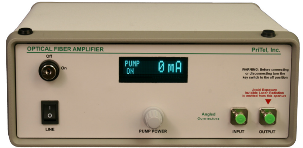
SPFA-L-xx model without power monitor option

PriTel's FA_L Series of Optical Fiber Amplifiers are designed for R&D applications in telecommunications, fiber lasers, and optical switching.