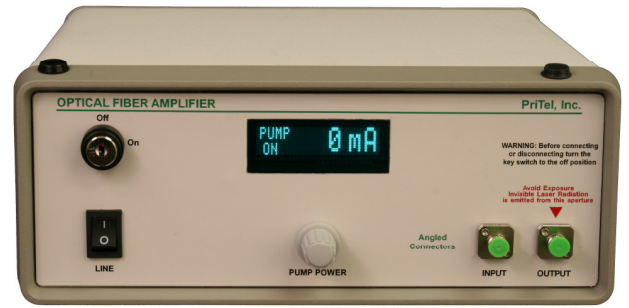
FA-xxL model without power monitor option