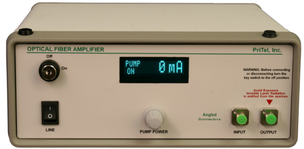
LNTFA-xx model with power monitor option